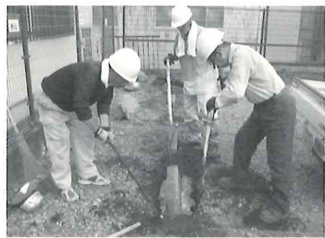
はりきり3人組！仕事の後は温泉だあ♡