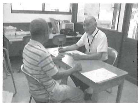
入会面接はドキドキ