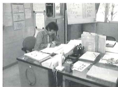
今日も笑顔で対応♪