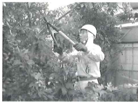
常にベストを尽くし！