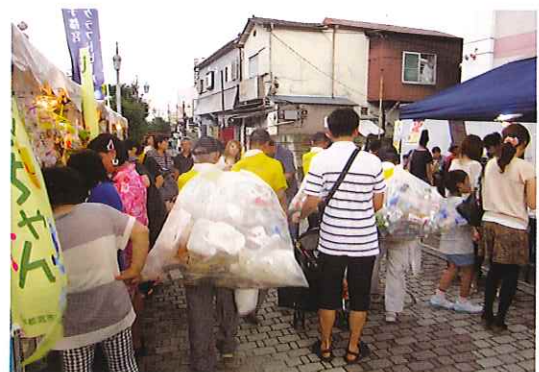
おそろいの黄色いTシャツの会員さんが ごみの回収をしました。