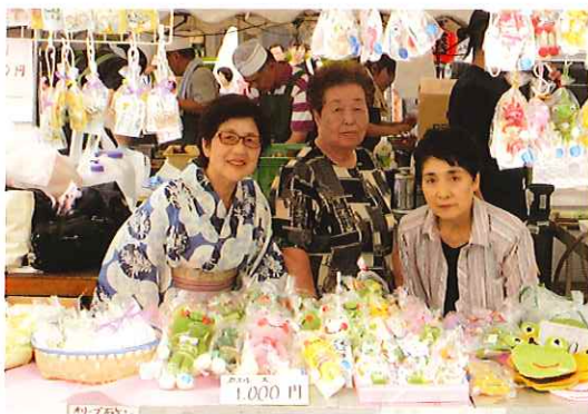
独自事業の編みぐるみ・石けん 豆ぞうりの展示・販売をしました。