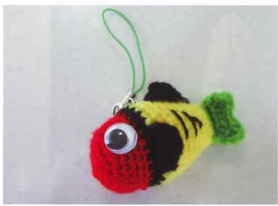
きぶなのストラップ