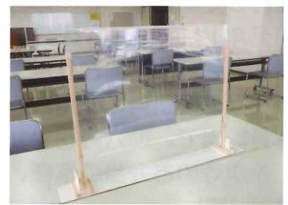
飛沫飛散防止用パーテーション