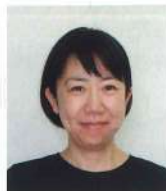
（業務第2課 漆原主査）