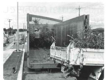
クリーンセンター下田原(剪定枝受入)

この他に7か所の現場を訪問し、おおむね適正な業務が行われていることを確認しました。