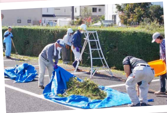
令和5年度 河内地域奉仕活動

センターでは、毎年10月を『センター事業普及啓発月間』とし、上河内・河内地域で奉仕活動を行っております。