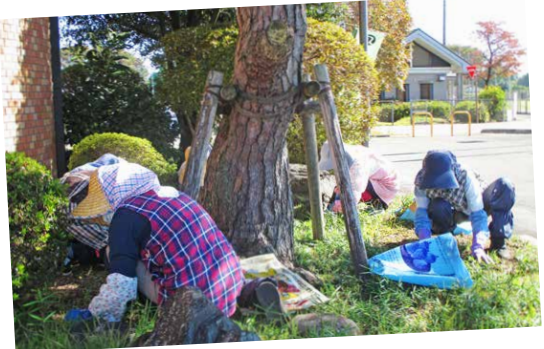
令和5年度 上河内地域奉仕活動

発行日 令和6年10月1日 発行者 公益社団法人 宇都宮市シルバー人材センター 事務局 宇都宮市中央1-1-15 宇都宮市総合福祉センター6階 電話 028-633-5300 E-mail utsunomiya@sjc.ne.jp