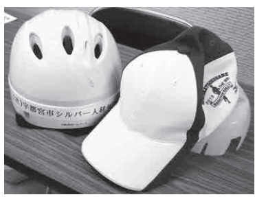
お二人のヘルメット 右は帽子とヘルメットが 一体となったタイプ