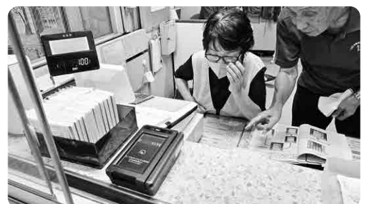
導入されたレジスター（上）と、 キャッシュレス決済用の端末（下）