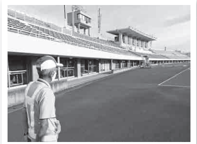
広い敷地内を歩き、消灯や 施錠確認のため、各施設を くまなく見回ります。