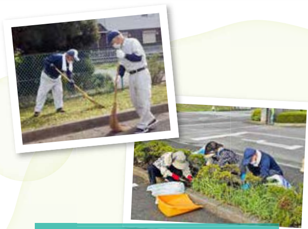
令和6年度 河内地域奉仕活動

発行日 令和7年10月1日 発行者 公益社団法人 宇都宮市シルバー人材センター 事務局 宇都宮市中央1-1-15 宇都宮市総合福祉センター6階 電話 028-633-5300 E-mail utsunomiya@sjc.ne.jp