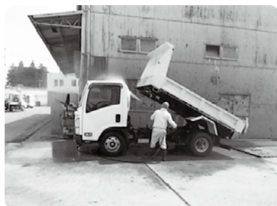
重機等の洗浄(派遣)