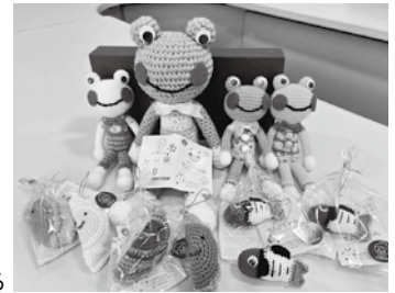
編みぐるみ班のかわいい作品たち (上段左から)カエルのちょこちゃん、餃子ストラップ、黄ぶなストラップ