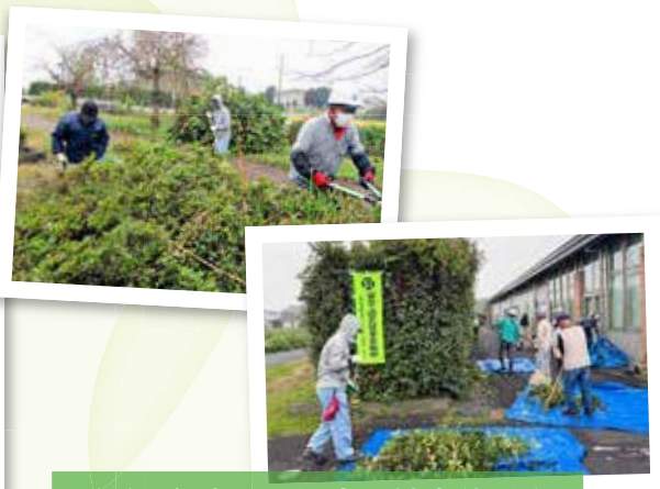
令和6年度 上河内地域奉仕活動

センターでは、毎年10月を『センター事業普及啓発月間』とし、上河内・河内地域で奉仕活動を行っております。