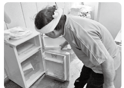
レンタル用品の清掃点検(派遣)