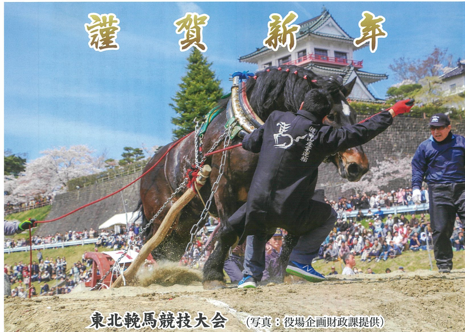
東北靱馬競技大会