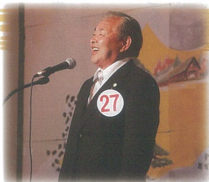
(第34回秋の山唄出場)

歌うことはお腹から声を出しますので健康にも良いと言われております。また、近年「表情筋」の大切さが盛んに言われております。カラオケなどで歌うとき、表情豊かになった気持ちで歌うのが最高の楽しみです。