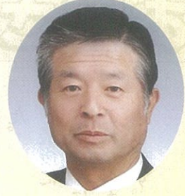
涌谷町長 大橋 信夫