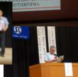
会員による安全宣言