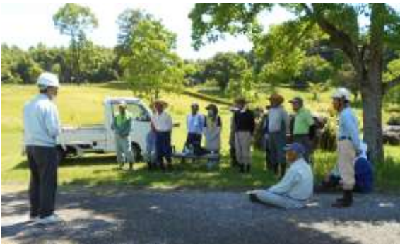
会員へのミニ安全講話