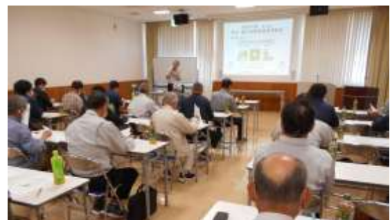
連合会安全・適正就業推進員の講義