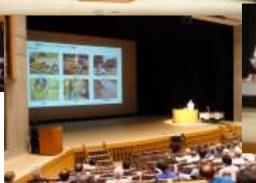
優良センター表彰