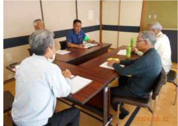
パトロール後の講評と意見交換