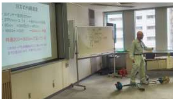
外部講師の講演（刈払機の安全講習）

研修会のメインテーマは、傷害事故及び損害賠償事故の削減に繋がるもので、外部講師に講演を依頼します。