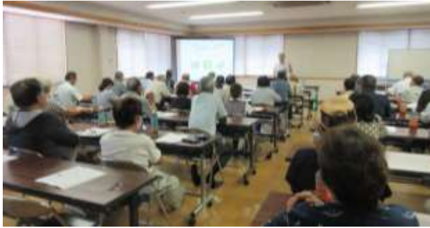
連合会職員の安全講話