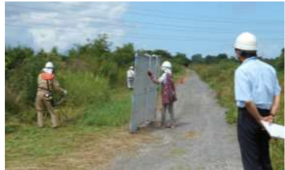
草刈り作業のパトロール