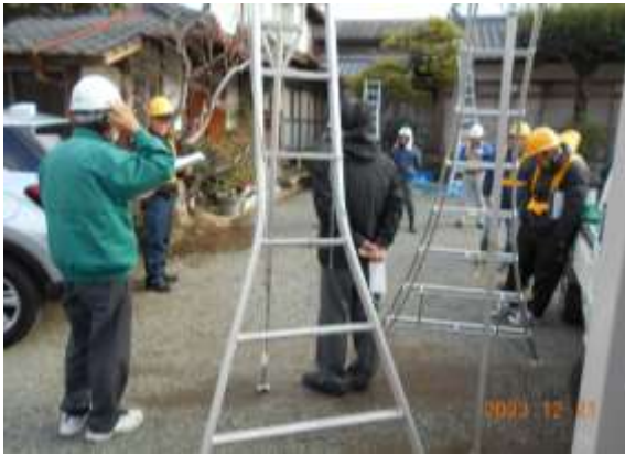
剪定作業のパトロール