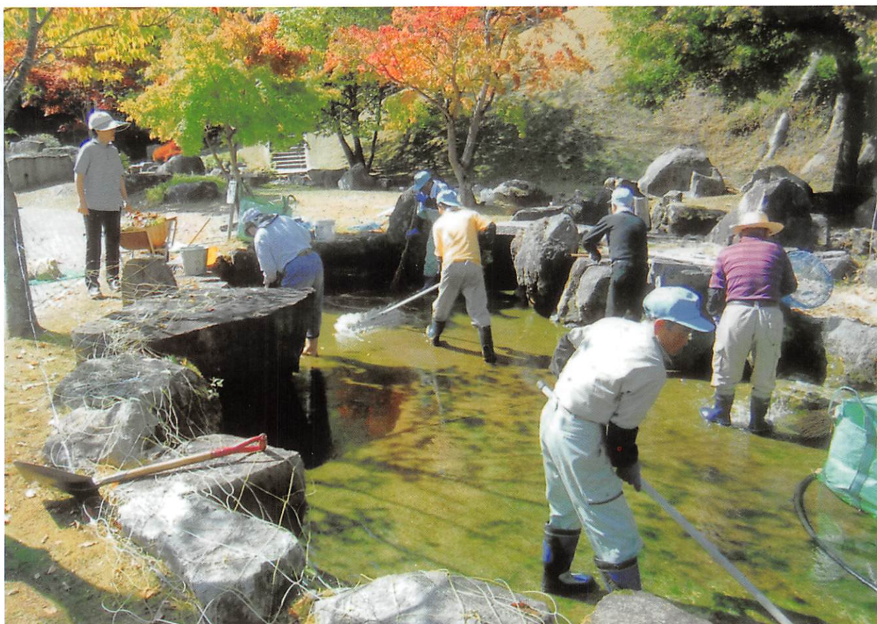
△広瀬ダム公園の池の清掃風景

編集 公益社団法人 東山梨地区広域シルバー人材センター 塩山事務所 0553-32-4110 山梨事務所 0553-22-4150