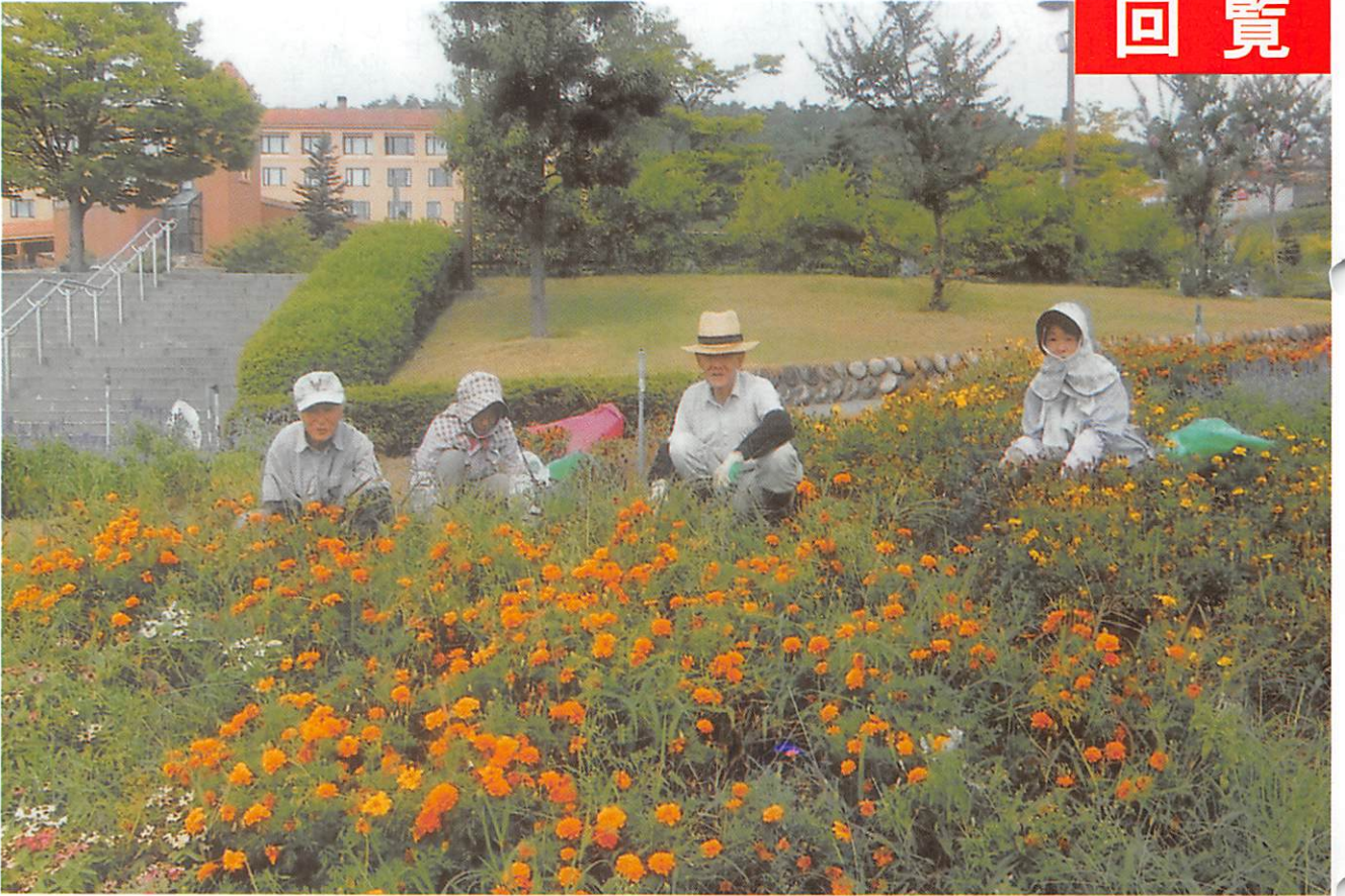
△「フルーツ公園」での除草作業風景