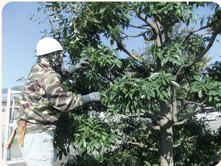
▲ 庭木の手入れ作業