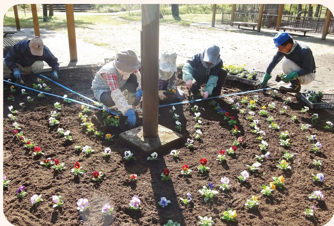
▲ 公園の花植え作業