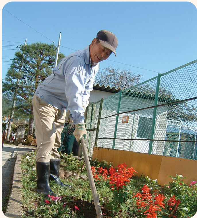
▲ 花壇の手入れ作業