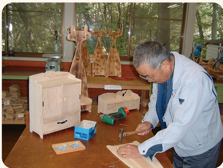
▲ 木工芸館の試作品製作作業