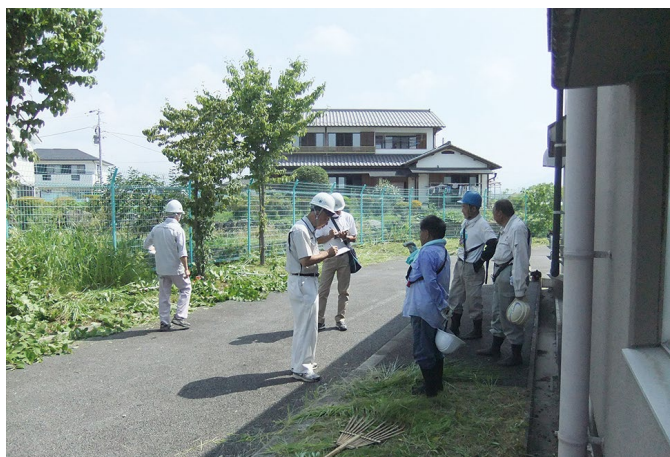
安全・適正就業強化月間の7月20日に、県連合会と合同の巡回パトロールが実施されました。

安全委員会では会員が安全に就業できるよう交通事故や就業中の事故ゼロを目指して、安全対策意識の高揚と啓発に努めています。