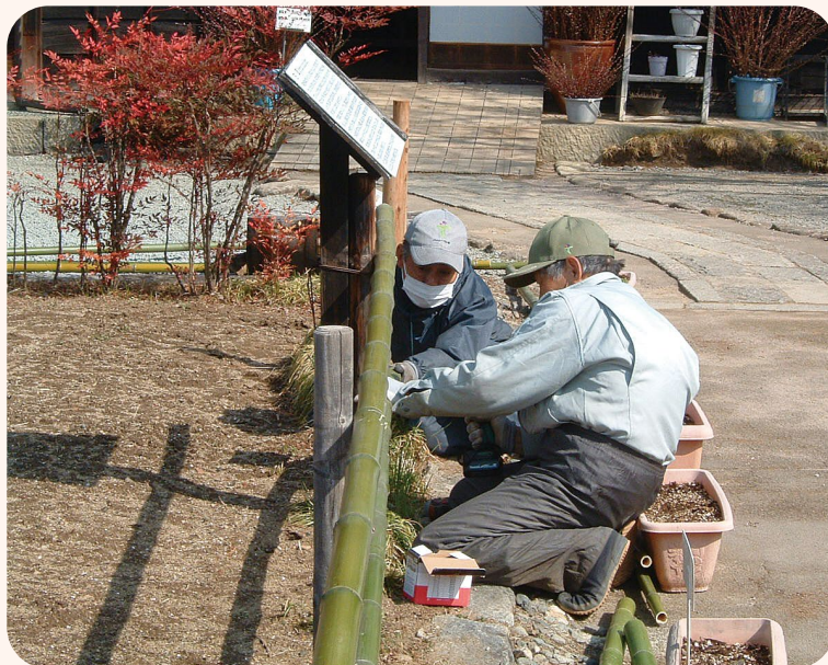
▲ 甘草屋敷前庭竹棚修理作業