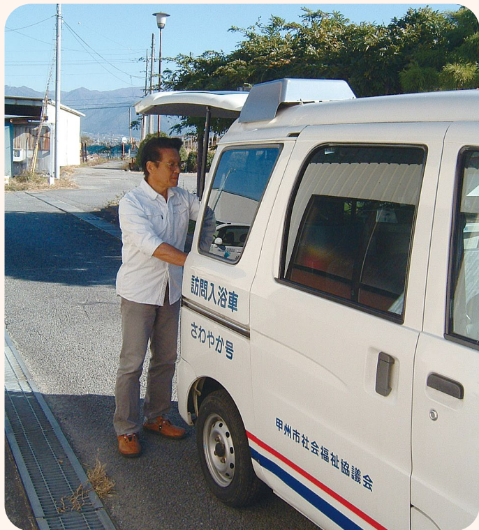
▲ 訪問入浴サービス及び運転業務（派遣）