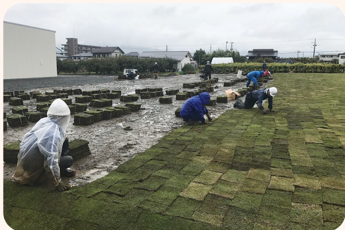
▲ 工場の芝生張り作業