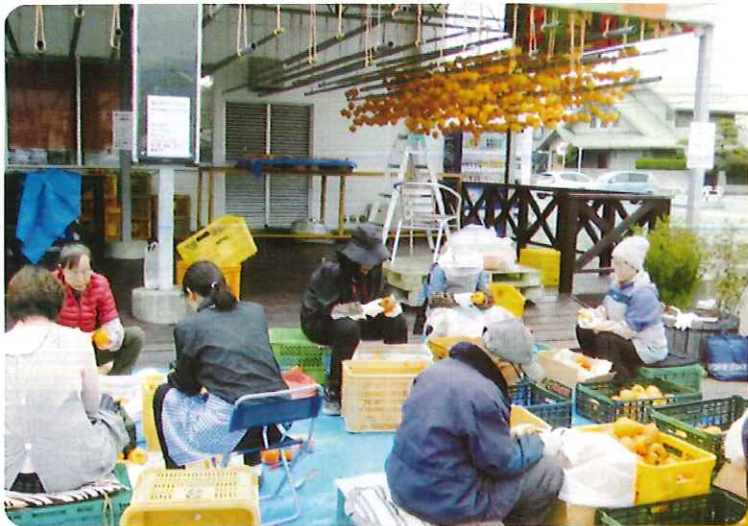
△柿の皮むき作業風景