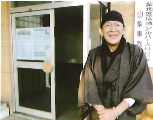
梨地区広域シルバー人材センター 山梨事務所

シルバー会員とは退役者を意味せず「経験に勝る知恵無し、力無し」高い年齢の実力を発揮できる誇り高い現役バリバリです。