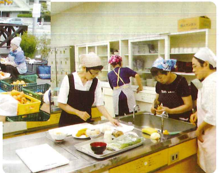
▽調理補助講習会風景