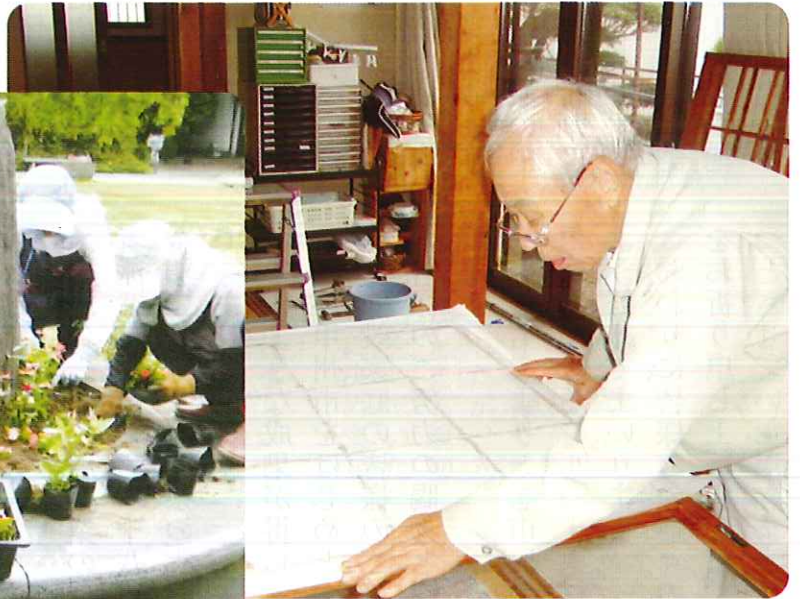
△障子紙の張り替え作業風景