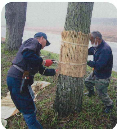
五本松の松並木のコモ巻風景