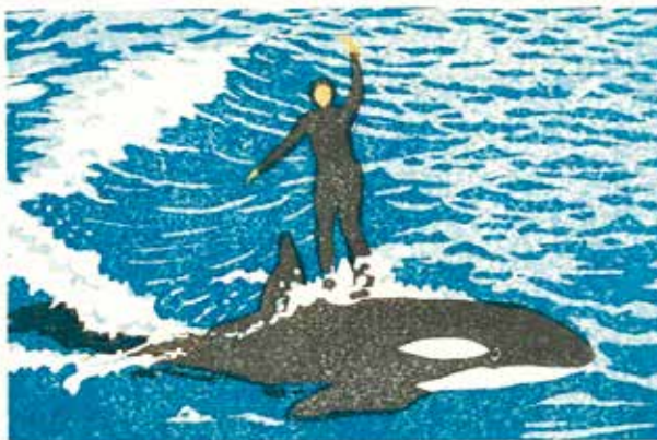
シャチに乗る（鴨川シーワールド）

版画に興味があったので、テレビで「趣味の木版画」という番組を見た時、木版木の技法を基礎から習って作品を作ってみたいと思いました。NHK文化センター「楽しい版画教室」の受講生になり、東京・青山にある教室に通い始めたのが63歳の春でした。木版画制作の楽しさを実感しながら、様々な題材に挑戦しました。けれども、いくら作品を作っても、それっきりになるのでは物足りません。自分の作品がひとからどのような評価が得られるのかが知りたくなり、思い切って公募展に応募することにしました。「日本版画会」という美術団体が主催する公募展に初めて応募した作品が入選。上野の東京都美術館に展示されました。それから毎年出品し今年の秋で4回目になります。