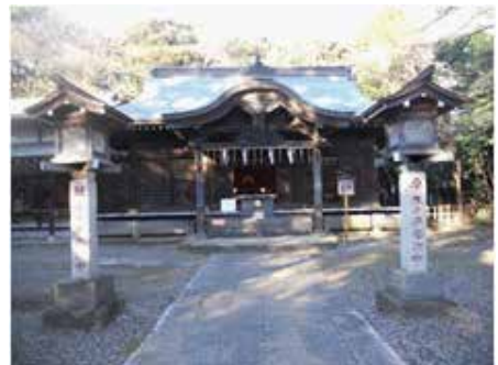
大原大宮神社（伯・母） 習志野市実籾 1-30-1