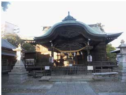
菊田神社（伯・父） 習志野市津田沼 3-2-5