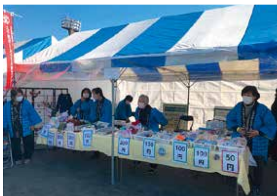
八千代市民祭出店の様子