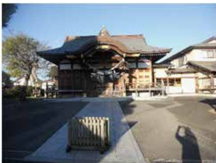
子守神社（子守） 千葉市花見川区幕張町 2-990