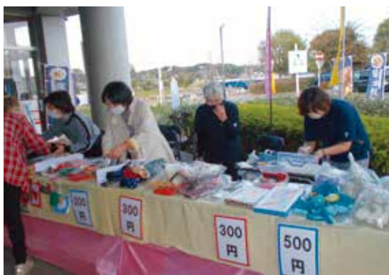
八千代ふるさとステーション出店の様子