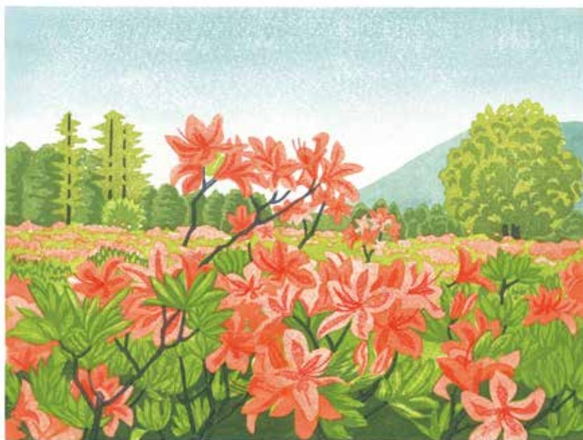
高原を彩る レンゲツツジ