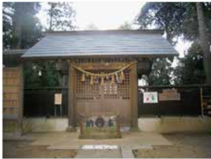
八王子神社（未・息子） 船橋市古和釜 161