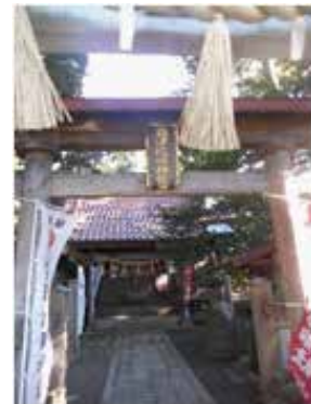
高津比咩神社（娘） 八千代市高津 294