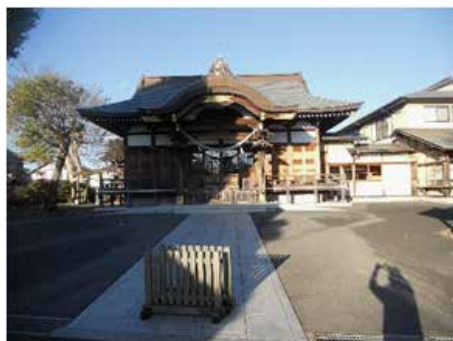
二宮神社（夫・父）船橋市三山 5-20-1