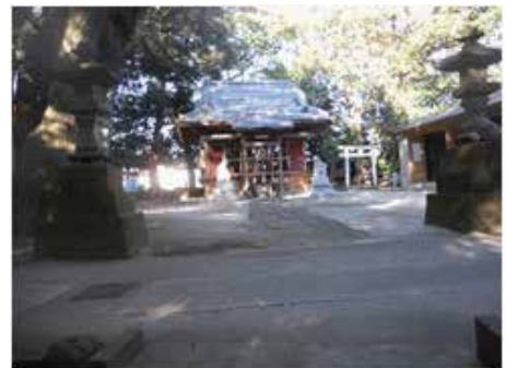
三代王神社（産婆） 千葉市花見川区武石町 1-4