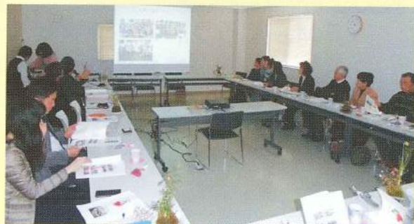
埼玉県入間市シルバー人材センター 輝く女性の会「愛称・さくらんぼ」へ視察と交流