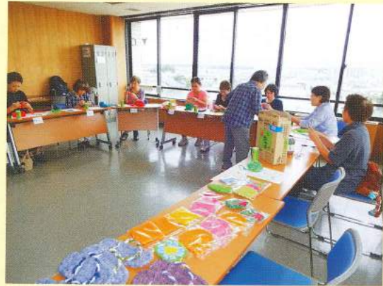
布わらじに初挑戦、時間を忘れ夢中で製作