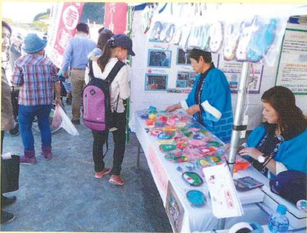
「2016八千代どーんと祭」 に初出展