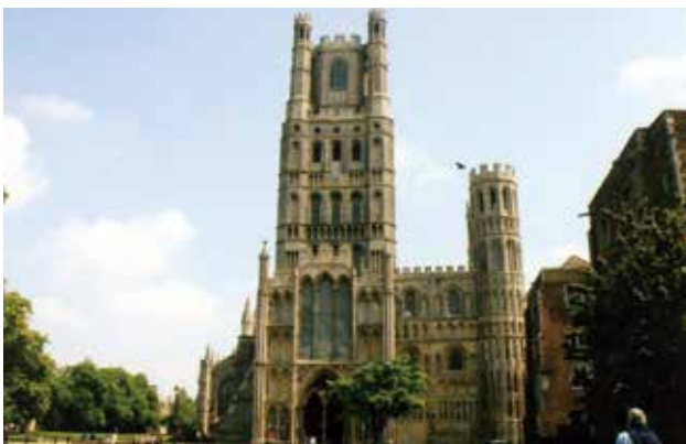
イーリー大聖堂 (ケンブリッジ州)

皆さんが気持ちよく勉強に集中できるように、春には『さくら咲く』ように願いながら今日も掃除しています。