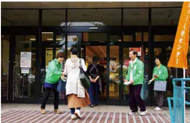
街頭啓発活動（イオン山形北店）