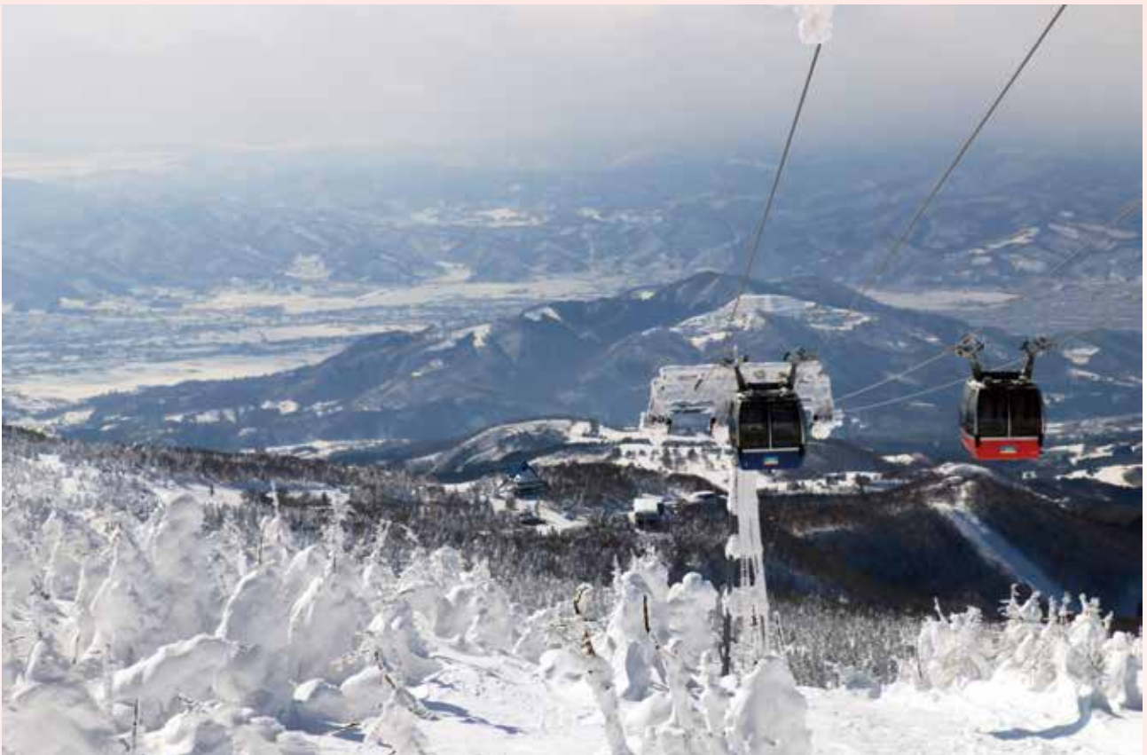
白銀の蔵王

(公社)山形市シルバー人材センター 正会員数1,204名 賛助会員 41個人・70団体(11月末現在)