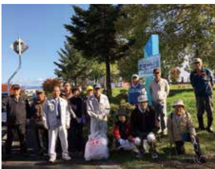
蔵王地区 ボランティア活動

現在地区の数は二十八地区。世話役として班長・副班長・組長をその地区の会員さんへお願いしております。それぞれの地区を担当する理事がおり、私の担当は第四地区と鈴川三地区、西部地区の三地区です。十月に鈴川地区の合同研修会（鈴川一・二・三地区）と西部地区研修会が行われ、担当理事として出席しました。