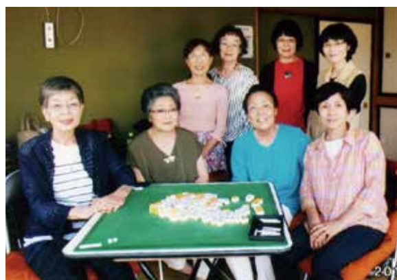
女性メンバーの集い