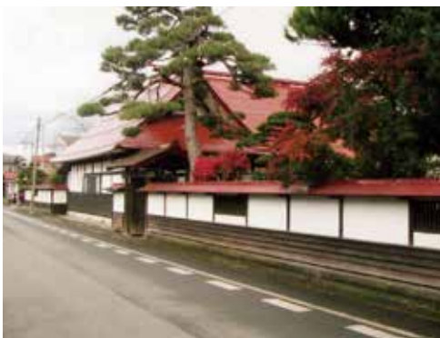
最上川舟運のおもかげを残す船町

また、地域一体となって取り組む子育て支援・教育環境も評価されております。これからも、農業振興地域の良さを活かし、都市の魅力と自然が融合した地域発展が見込まれる住み心地のいい街であると思っております。