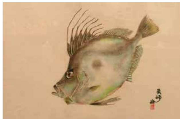
色彩魚拓 カガミダイ 蔵王 古澤 英雄