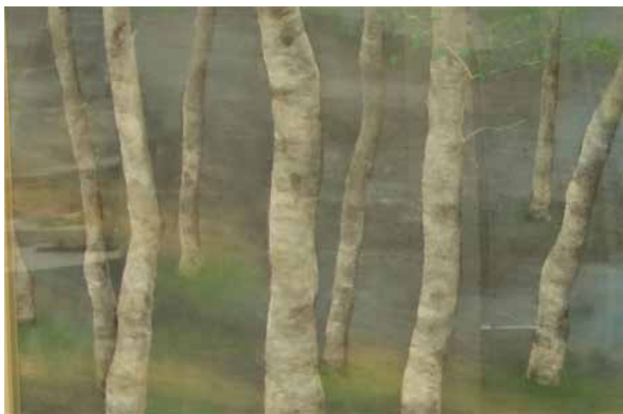
絵画 白樺 第2 鈴木 靖子