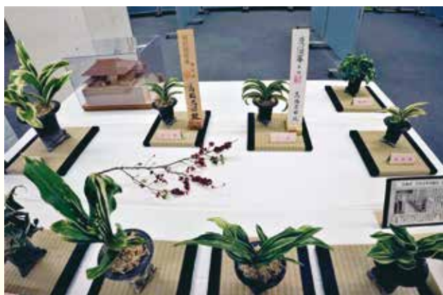
盆栽 オモト (万年青) 鈴川3 高橋 忠昭