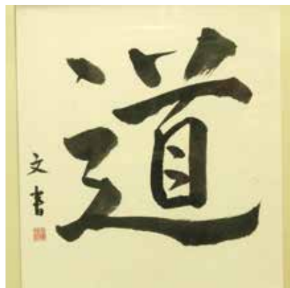
毛筆 道 東沢 齋藤 文