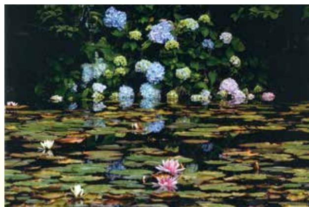
写真 すいれんとアジサイ カメラ愛好会 高橋 秀一