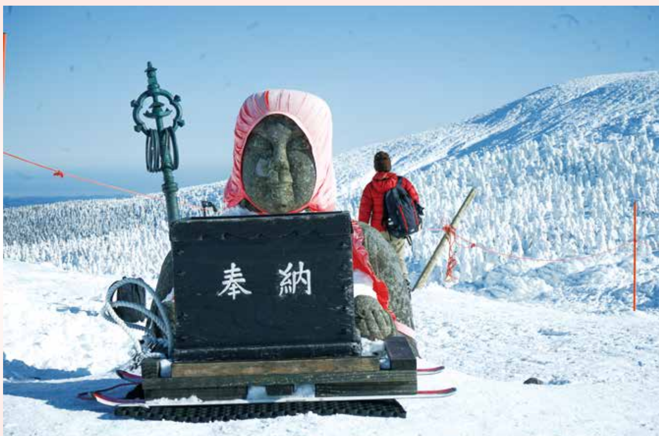
蔵王地蔵尊

(公社)山形市シルバー人材センター 正会員数1,282名 賛助会員 35個人・66団体(11月末現在)