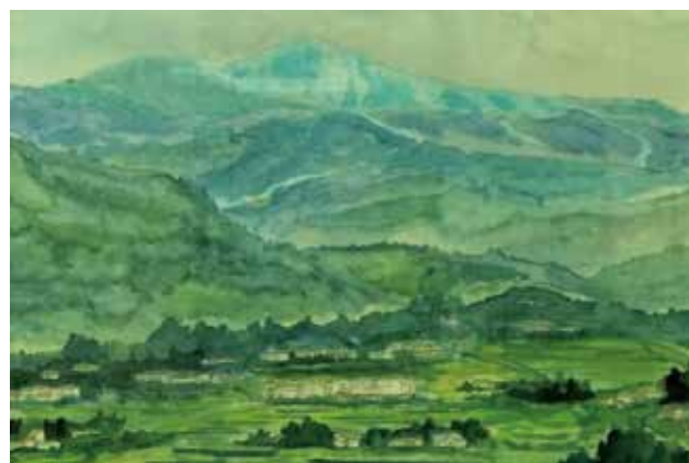
絵画 みはらしの丘より 南山形・本沢 古内 藤一