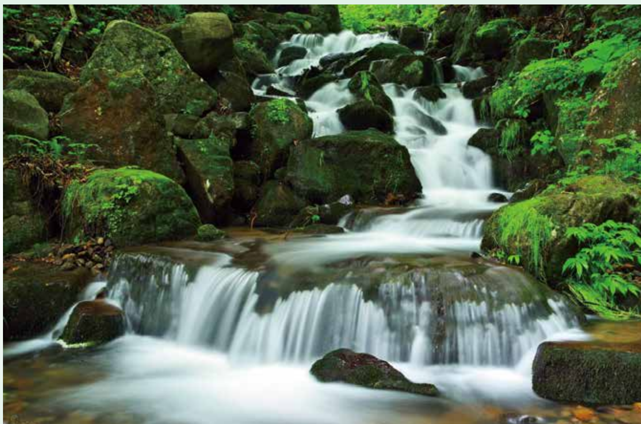
「涼滝」蔵王温泉 横倉滝

第147号 令和4年7月1日発行 (公社)山形市シルバー人材センター 正会員数1,184名 賛助会員 33個人・65団体(5月末現在)