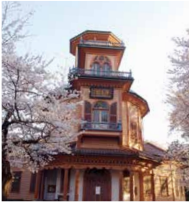
山形市郷土館（旧済生館本館）

にある財部稻荷神社の祭典で子供神輿が町内会で行われています。子供らのにぎやかな掛け声。保護者も一緒になつて「お札」と「お神酒」を配って歩きます。少ないながらも露店も出て、焼きそばとか買い求める子供らの姿があり郷愁を誘われます。 コロナの影響で、子供神輿も中止が続き、霞城公園も人通りが少なくなってきました。早くコロナが収束し、にぎやかな街に戻って欲しいと願っております。