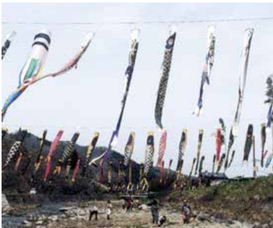
高瀬川の鯉のぼり

いただき、桜の時期から五月中旬まで色とりどりの鯉のぼりを泳がせてくれます。 高瀬地区には、他にも伝統芸能の「田植踊り」「大黒舞い」などがあり、毎年十月の地区文化祭にて披露されております。 自然豊かな里山山寺・高瀬地区には是非一度足を運んでみてはいかがでしょうか！