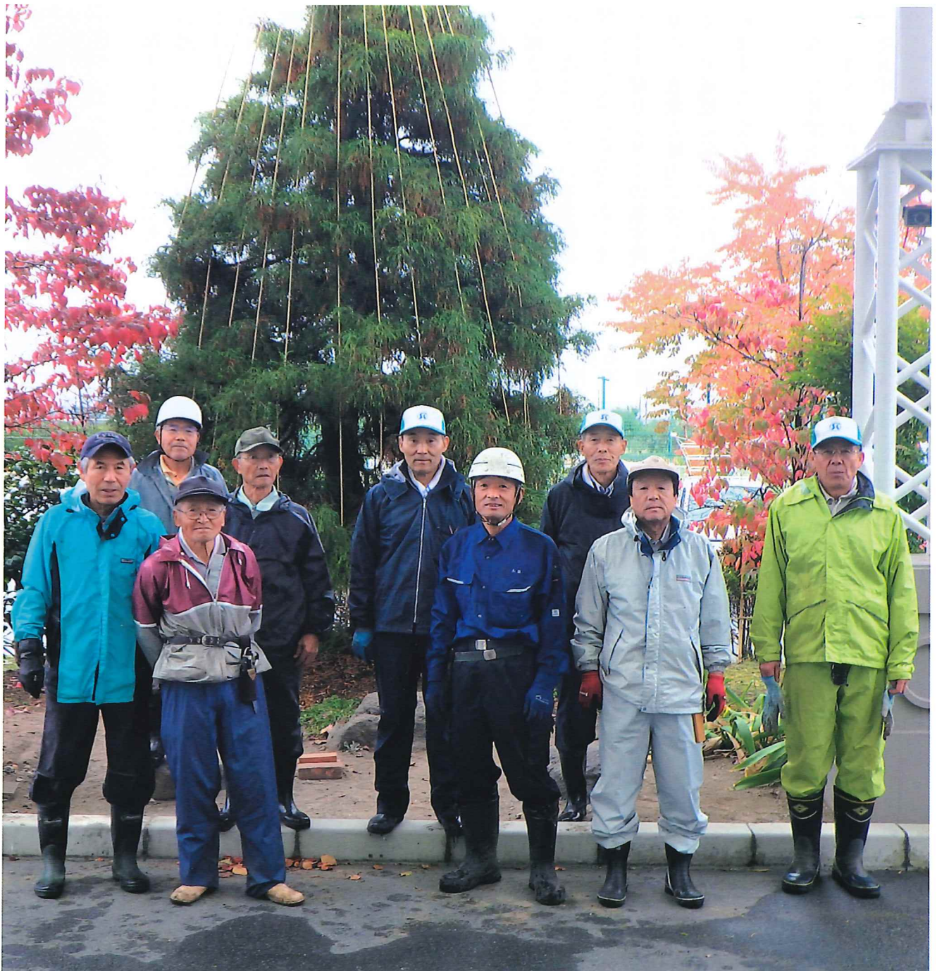
雪囲いボランティア活動