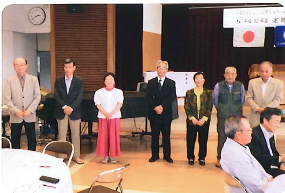
新互助会役員の紹介