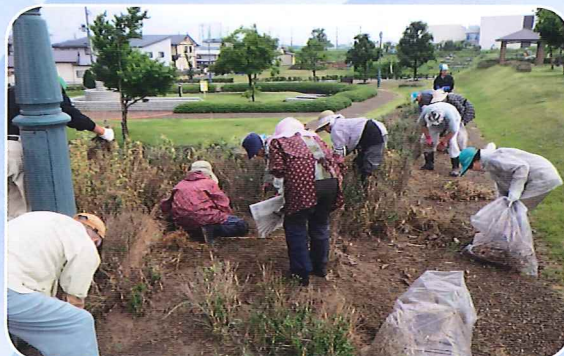
除草ボランティア