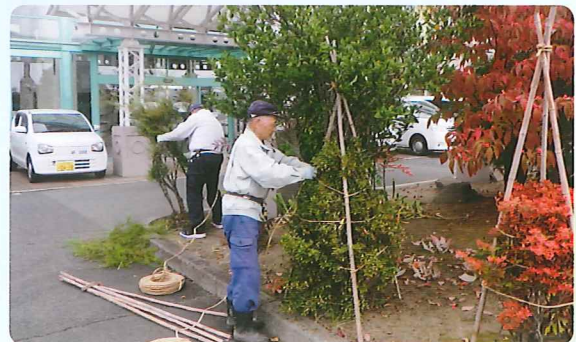
雪囲いボランティア