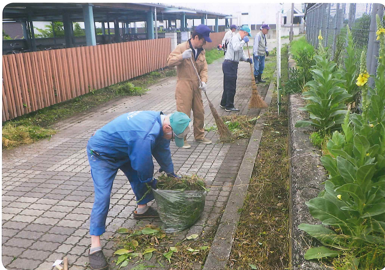
除草ボランティア活動(山辺駅前公園・歩道)