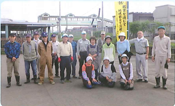
除草ボランティア