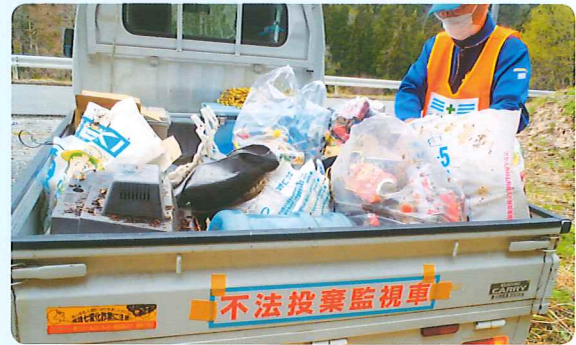
不法投棄パトロール