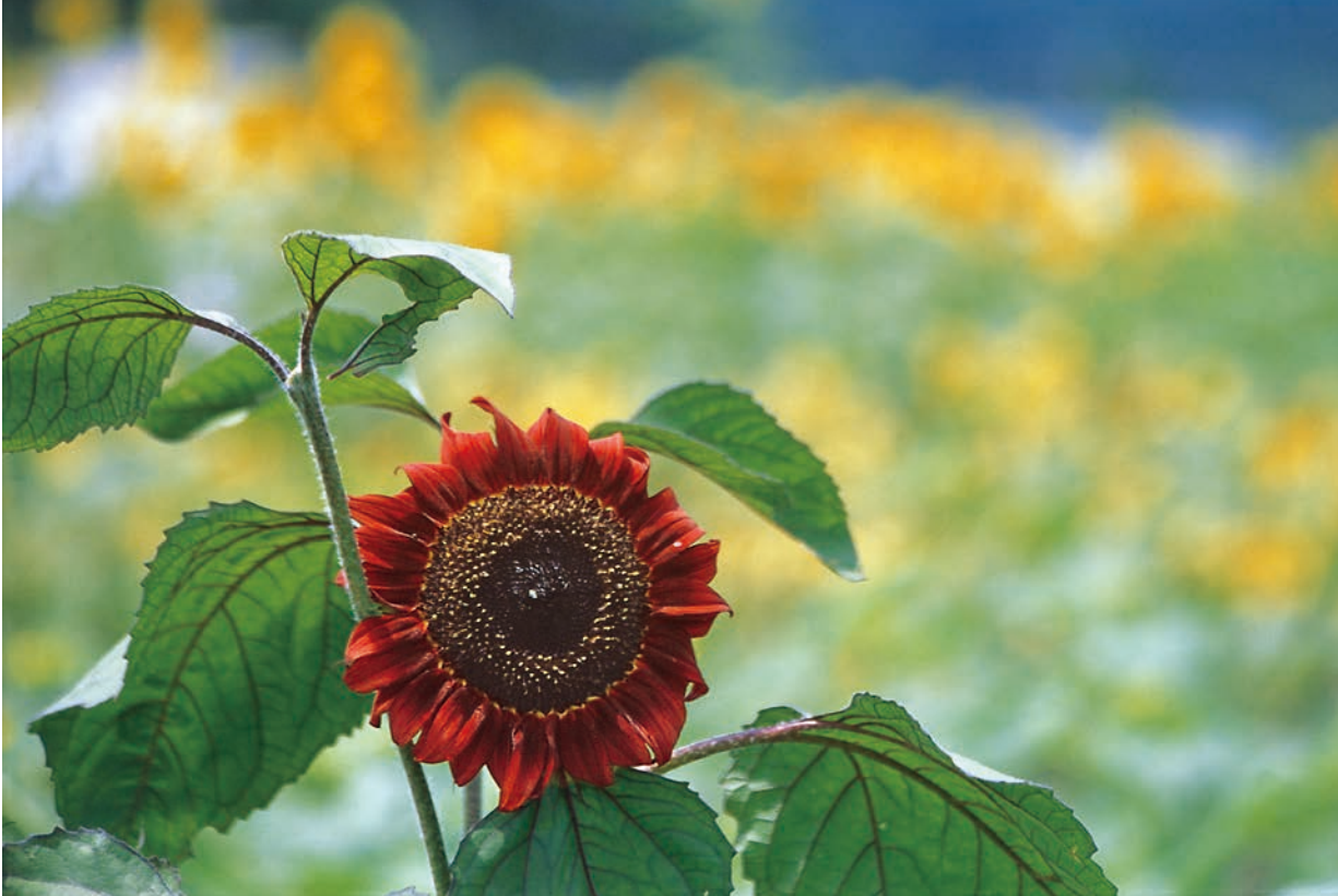
紅いのひまわり（兵庫県佐用町）