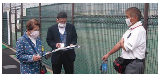
▶就業現場の巡回 ▼交通安全講習会

をはじめ、定期的に会員の就業現場の巡回を実施し、事故の未然防止と会員が安心して就業できるような環境づくりに努めています。また、会員の安全への意識の高揚を図るため講習会などを行っております。万が一事故が発生した場合、会員の傷病等に関するフォローアップを行うとともに、事故要因分析を行い、事故発生事例・再発防止などを会員の皆様へ広報誌で周知しております。