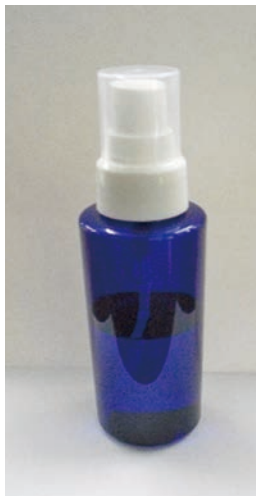
除菌・消臭アロマオイル