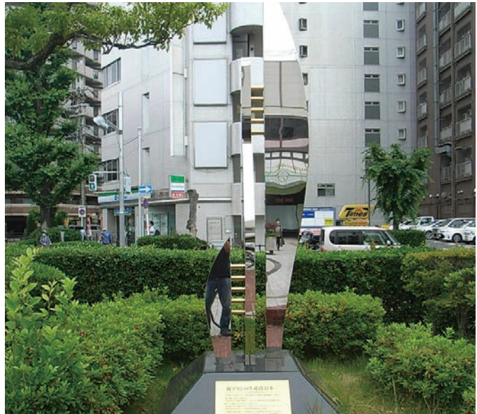
二、わが街・風景「ここはどこ？」

▼ ハガキ・メール・FAXにて答え・住所・氏名・会員番号・コメントを書いてお送りください ☆ 正解者の中から抽選で5名の方に図書カードをプレゼントします ▼ いずれか一問で正解とします。 ▼ 締切 9月末日 ▼ 宛先 〒581-0815 八尾市宮町1-10 | 32 (公社) 八尾市シルバー人材センター 編集会議 FAX 072-992-8282 Eメール yao.sc@dream.ocn.ne.jp ◎ 90号の答え (正解者6名) 一、①もえぎ ②えびちゃ ③ひわだ ④しよう じょうひ ⑤あかね ⑥いっこんぞめ ⑦う めねず ⑧さくら ⑨とき ⑩ぼたん 二、JR久宝寺駅前