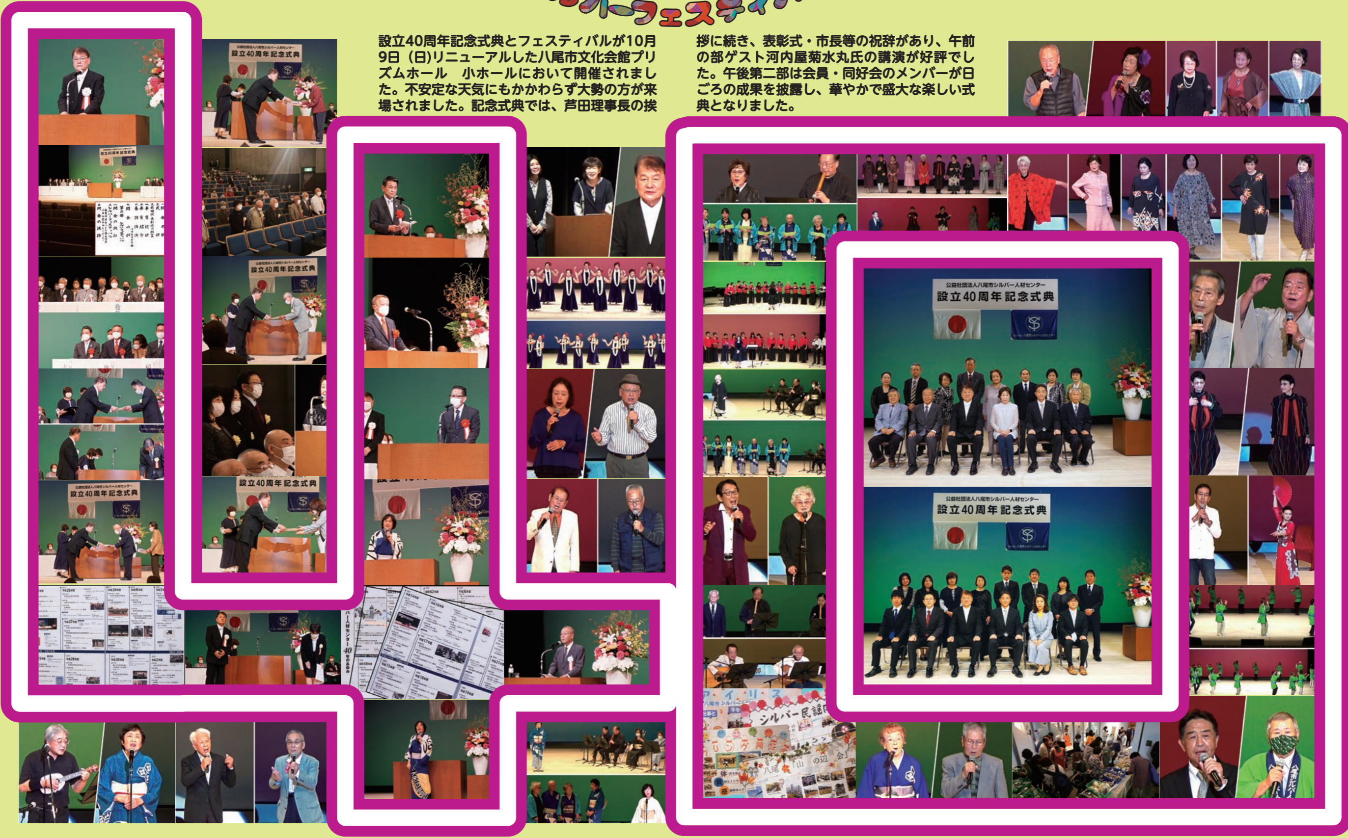
☆「今迄は 大丈夫だった！」が 事故のもと 作 / 森 昌子