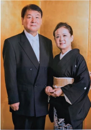
第60回 金婚式・長寿を祝う会 2022年10月19日

夫婦であっても思い出に残る出来事はそれぞれで、私は沖繩返還の深い意味あいよりも今日から車が左側通行になるというニュースがなぜか忘れられません。家内はやはり上野動物園に見に行ったパンドが脳裏に焼き