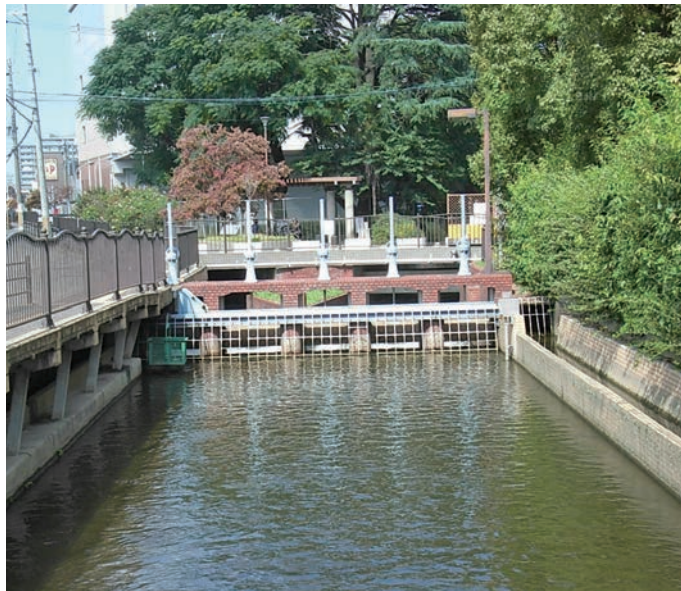
二、わが街・風景「ここはどこ?」

▼ハガキ・メール・FAXにて答え・住所・氏名・会員番号・コメントを書いてお送りください ☆正解者の中から抽選で5名の方に図書カードをプレゼントします