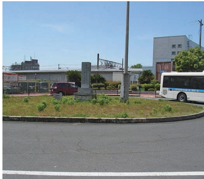
二、わが街・風景「ここはどこ?」