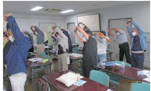
健康管理講習会の風景

右のグラフは、過去5年間の事故件数です。昨年度の事故件数は32件（傷害30件・賠償2件）でした。今年度は、4月から3ヶ月過ぎようとしています。6月末日現在で傷害9件・賠償事故4件の事故が発生しました。『安全はすべてに優先します』日々の安全確認・事故防止に一層の注意を払い、『事故ゼロ』を目指して安全第一でお願いします。 安全・適正就業委員会では、会員の皆様就業中や就業途上（就業の行き帰り）における事故やケガの事故状況の分析を行い、事故防止のための講習会などの企画・実施に関する事や事故発生状況や事故防止の啓発を行っています。