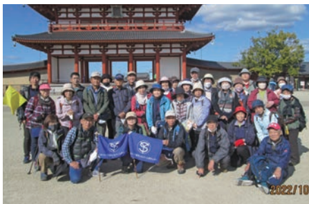
秋の健康ハイキング

なお、月1回の安全巡回パトロールや7月については、国が実施する『全国安全週間』に合わせて、安全適正就業強化月間として、一般企業先や屋内外作業など会員の皆様が仕事をしている所に訪問し、就業中の労をねぎらい、コミュニケーションを図りながら事故防止のための啓発活動を行っておりますので、ご協力をお願いいたします。