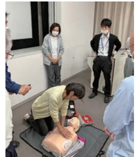
普通救命・AED講習会

おける事故やケガの事故状況の分析を行い、事故防止のための講習会などを企画して実施しております。