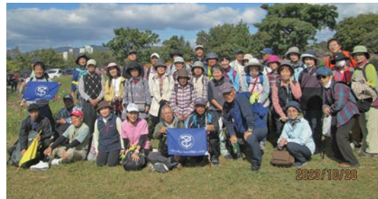
秋の健康ハイキング

令和6年度も『交通安全講習会』『健康に関する講習会』や健康増進のための『秋の健康ハイキング』『普通救命・AED講習会』を実施予定しております。ご参加をお待ちしております。