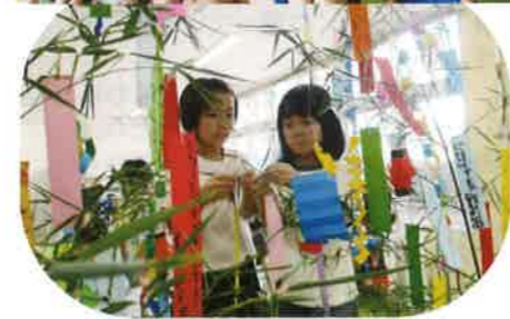
みんなの願い事は 聞いてもらえるかな？