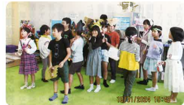
魔女からのプレゼントを待ってるよ！