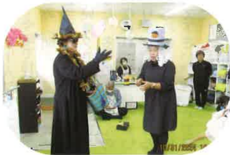
魔女は誰でしょう？