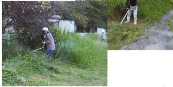
◆島田小学校周辺 草刈 (9月28日)