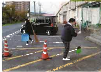
◆プラーナ 木戸川沿い清掃 (10月26日)