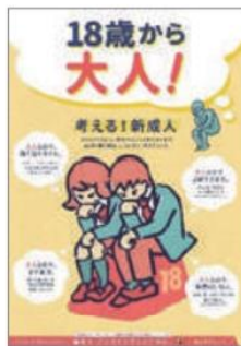
キャンペーンのチラシ

このキャンペーンは、昨年11月から今年の2月末まで、市内20か所の同一場所で20回実施し、他に4つの大学でも配布するという大掛かりなものです。