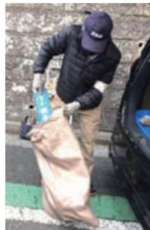
撤去した表示板を回収する

高い所での作業であるため、安全性に最も気をつけています。脚立を使うときは、一人が周囲の安全確認と、脚立を押さえる等をして脚立を固定し、もう一人が作業をします。作業中、その横を通る人たちに物が当たらないように目を配り、特に、車やバスの通る道路での作業は、かなり注意をしています。二人の協力が欠かせない場面で、息の合った作業が進められていました。