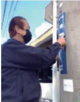
水平になるように慎重に、シール製の新しい表示板を貼る

現地に到着すると、まず現況を写真に撮り、古いアルミ製の表示板の撤去を行います。中にはガツチリと固定されているものもあり、撤去するのに苦労しますが、留めてあるアルミ製のバンド等を、強力なハサミで切り取ります。その後、新しいシール製の表示板を設置し、完成したところを写真に撮り、作業の完了となります。一カ所の作業にかかる時間は、長い場合で約30分です。