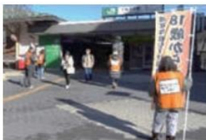
十日市場駅前で活動する会員