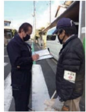
地図で場所の確認

今回の作業は、昨年11月から今年1月まで、概ね週に2日、晴天日の9時から15時までの間に行っています。