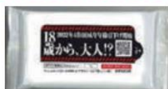
配布したウエットティッシュ

成年年齢が引き下げられたことの周知が目的です。成年に達すると、親の同意がなくても契約出来るため(未成年者の場合は、親の同意がない契約は原則として取り消せます)、例えば悪徳商法等、消費者トラブルに巻き込まれないよう注意喚起を実施します。