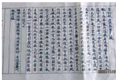
会員 No.701 写経~サロンにて~