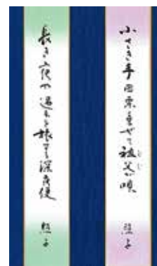
会員 No.847 俳句 二句