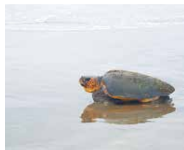
産卵を終えた親亀