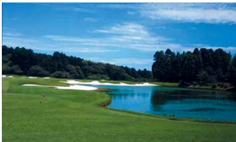
カレドニアン・ゴルフクラブ 18th

グリーンを早くするためには、ワインの話を楽しみましょう。何年か前に、東京・三田にあるワインの会に、富里のメンバーと行った時、地下にワインが保存してある所の地下のワインを飲む会で…その時のそのお店の方が説明して下さいました。美味しいワインを作る話でした。ぶどうの木は乾いた台地に植えると、根っこは水を欲しがり30m〜40m位下まで根を伸ばします。そして、太古の昔の土の栄養も吸収し、味わい深く旨みを増すとのことでした。今もそのぶどうの木は百五十年も生きています。私がおの時思ったのは根っこは水が欲しければ根を伸ばす。肥料が欲しければ隣に根を伸ばし横取りするのは知っていましたので、水やりを控えることを主人に提案し、早速実験開始。グリーンは砂地、