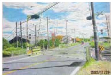
会員 No.886 横芝光町内風景