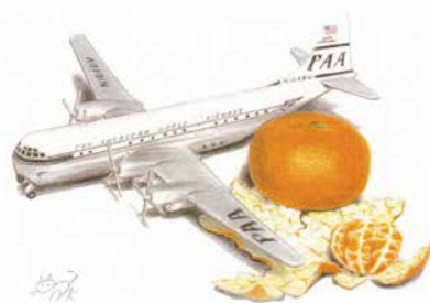
イラスト：会員的那須幸利氏