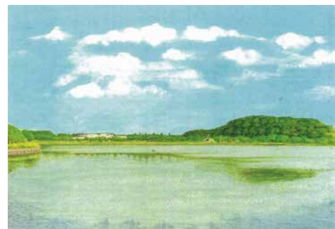
イラスト：会員的那須幸利氏