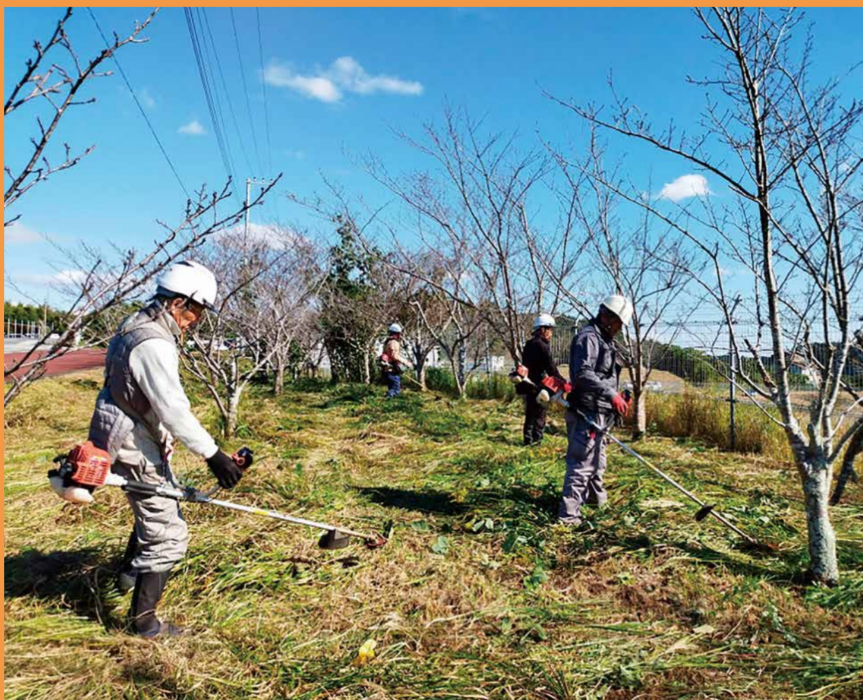
工業団地 会員の除草作業風景