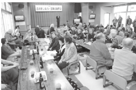
新年会（令和元年度）