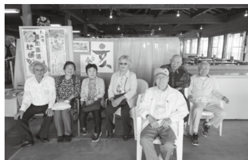
日帰り旅行（令和元年度）