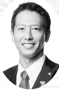
吉川市長 中原 恵人