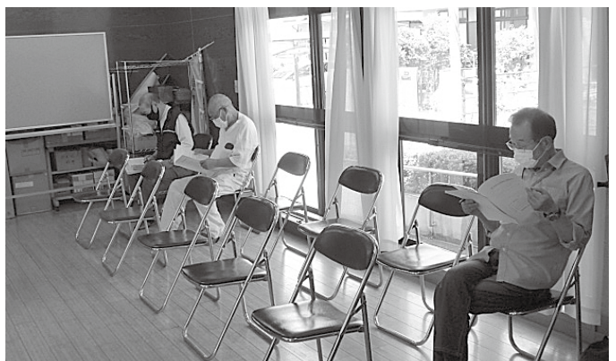
新型コロナウイルス感染防止対策として座席の間隔をあけ開催しました