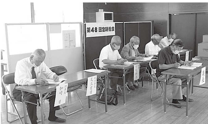
ご出席頂いた理事の皆様