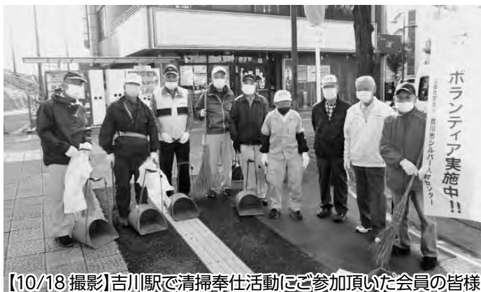
【10/18撮影】吉川駅で清掃奉仕活動にご参加頂いた会員の皆様

毎月第3日曜日に開催している吉川駅及び市民交流センターおあしすの清掃奉仕活動を7月19日(日)から再開しました。感染対策として密にならないように、また作業中はマスクを着用の上、距離を開けて奉仕活動を実施しました。久しぶりの活動でしたが、皆さん身体の鈍りもなく、もくもくと取り組んでいただきあっという間に綺麗にすることが出来ました。