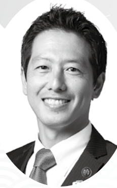
吉川市長 中原 恵人