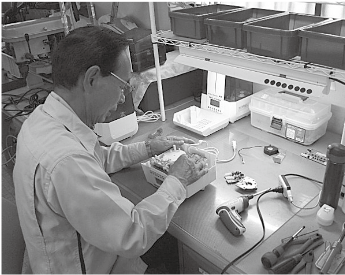
製品の点検及び修繕作業