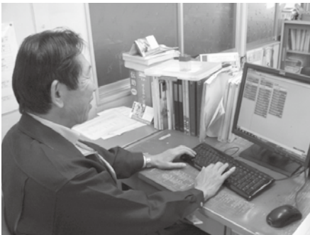
進竹産業(株)様 経理作業