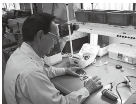
(株)テクノマックス様 部品点検作業