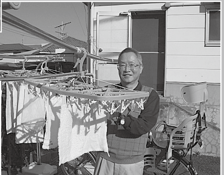
保育園用務員作業

■発行 公益社団法人 吉川市シルバー人材センター TEL.048-982-7720 FAX.048-981-7199 〒342-0058 埼玉県吉川市きよみ野二丁目22番地2 E-mail : yoshikawa@sjc.ne.jp ホームページ : http://www.yoshikawa-sc.or.jp