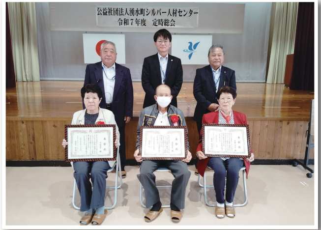
令和7年度会員表彰