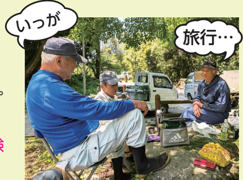
作業休憩中・・・旅行、気になりますね