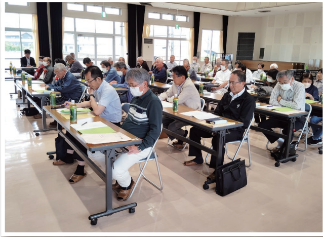
令和7年度定時総会

令和7年度定時総会が5月29日湧水町栗野中央公民館にて開催されました。今年度は7名の会員が表彰を受けられました。