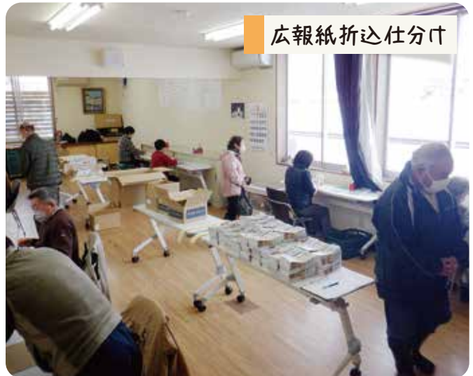
広報紙折込仕分け